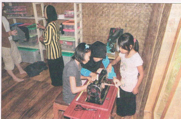
Nähunterricht für Kinder im 1. Haus.