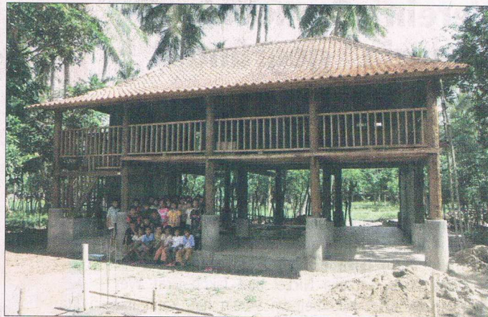
Freudige Sternenland-Kinder vor dem 1. Haus.

Natürlich war es mit dem Fahrradfahren alleine nicht getan. Nach dem 5-wöchigen Aufenthalt auf Lombok mussten dann alle Sponsoren angeschrieben werden um die Spenden einzufordern und um dann nach dem Zahlungseingang auf das Vereinskonto, die Spendenquittungen ausstellen zu können. Nun kann sich der Verein auf über tausend Euro freuen die in das Projekt Sternenland fließen werden. Mit Sternenland indonesisch „Tanah Bintang“ wird ein Platz für Kinder geschaffen. Derzeit kommen schon über 120 Kinder ins „Sternenland“, wo zusammen gelesen wird, den ganz Kleinen werden erste Schritte in Rechnen, Lesen und Schreiben beigebracht. Ab der 3. Klasse wird Englisch unterrichtet und jedes Kind darf sich dort pro Woche ein Buch ausleihen da es an den meisten Schulen keine Bibliothek gibt. Zurzeit laufen die Arbeiten für das zweite Gebäude in dem eine